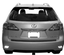
Lexus RX 350 and RX 450h